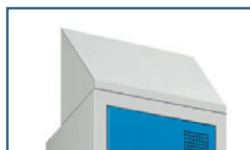
En option : coiffe inclinée