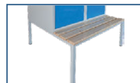
En option : pieds en tube carrés 30x30 avec patins plastiques et assises bois