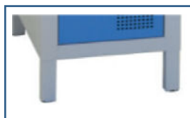
En option : pieds 30x30 acier 100 mm