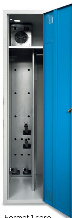
Format 1 case