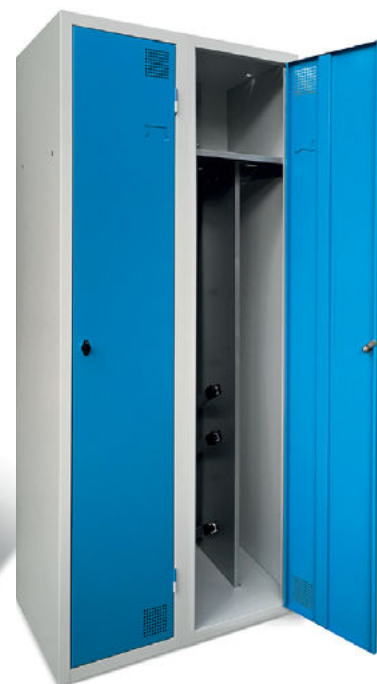
Format 2 cases